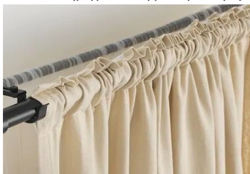
Εικόνα5: Ραφή σωλήνα