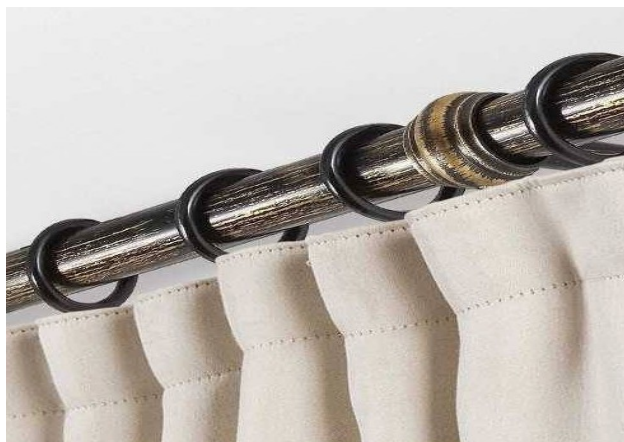
Εικόνα3: Ραφή κλασική με τρέσα συνεχόμενης πιέτας

Για το πλάτος μετράτε το διάστημα ανάμεσα στα δύο στηρίγματα της κουρτινόβεργας.