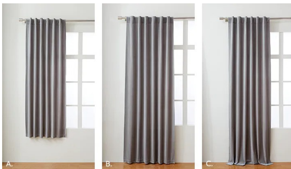
Εικόνα1: Επιλογές ραφήματος μήκους κουρτίνας

Επίσης, έχετε υπόψη σας και το φάρδος από τη τρέσα (σιρίτι) της κουρτίνας. Εμείς χρησιμοποιούμε λευκή τρέσα (φάρδος τρέσας 7cm) με συνεχόμενη πιέτα, αναλογίας 1 προς 2,5 και 3 υποδοχές (Εικόνα2) για να μπει το γαντζάκι, έτσι ώστε να υπάρχει η δυνατότητα να ρυθμίσετε λίγο το ύψος. Εάν θέλετε η κουρτίνα σας να κρύβει το σιδηρόδρομο, τότε θα βάλετε τα γαντζάκια στην πιο κάτω υποδοχή. Αυτό το φάρδος από το σιρίτι θα πρέπει να το συνυπολογίσετε στο ύψος.